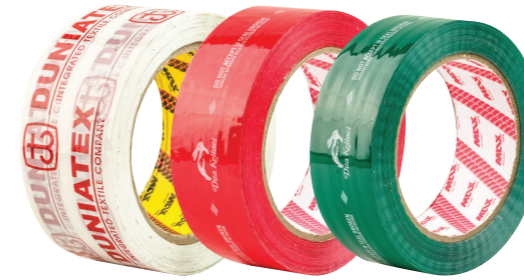
Logo Printed Tapes