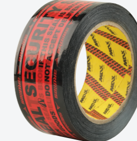
Security Seal Printed Tapes